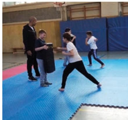
Taekwondo Verein Meiderich