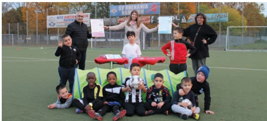
Übergabe der Jubiläumsurkunden beim SV Rhenania Hamborn