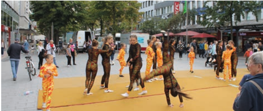
Fotoimpressionen aus 2019