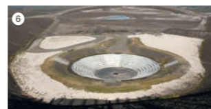
Die Halde Haniel in Bottrop (an der Grenze zu Oberhausen-Königshardt) ist mit 159 m Höhe (184,9 m über Normalnull) eine der höchsten Halden des Ruhrgebiets. Aufgetürmt wurde sie in Form zweier Spiralen durch Abraum der Steinkohlezeche Prosper-Haniel. Im Norden schließt sich die Halde Schöttelheide an.