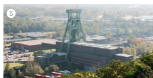
Das Bergwerk Prosper-Haniel in Bottrop ist seit der Schließung der Zeche Auguste Victoria am 18. Dezember 2015 das letzte aktive Steinkohlen-Bergwerk im Ruhrgebiet. Im Jahre 1974 fasste die Ruhrkohle AG die Zechen Prosper, Jacobi und Franz Haniel zum Verbundbergwerk Prosper-Haniel zusammen. Das Bergwerk soll Ende 2018 geschlossen werden.