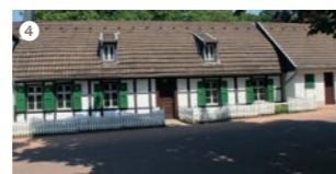
Ein Besuch der St. Antony-Hütte verspricht Spannung pur. Auf der Hütte lebten und arbeiteten Protagonisten, ohne die das Ruhrgebiet nicht das geworden wäre, was es heute ist: Jacobi, Haniel, Krupp, Wenge – allesamt bedeutende Persönlichkeiten der Schwerindustrie. Die Hütte ist auch Wiege des späteren Weltkonzerns Gutehoffnungshütte (GHH).