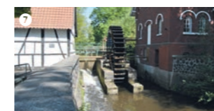
Der dörfliche Stadtteil Hiesfeld besitzt als besondere Attraktion gleich zwei Mühlen, eine Wassermühle sowie eine vollständig erhaltene Windmühle. Beide sind Teile des Hiesfelder Mühlenmuseums, dass seit 1976 vom Förderverein „Windmühle Hiesfeld e.V.“ betreut wird. Besucher haben Gelegenheit, über vier Etagen die gesamte Einrichtung einer Windmühle zu erkunden.