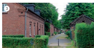
Die Arbeitersiedlung Eisenheim ist über 150 Jahre alt und somit die älteste ihrer Art aus der Zeit der Industrialisierung im Ruhrgebiet. Die Siedlung wurde 1846 von der späteren Gutehoffnungshütte für ihre Arbeiter gebaut. Heute befindet sich im ehemaligen Waschhaus der Siedlung das Museum Eisenheim, das die Geschichte vom ehemaligen Wohnen in der Siedlung dokumentiert.