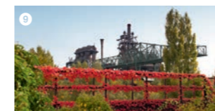
Der Landschaftspark Duisburg-Nord rund um ein stillgelegtes Hüttenwerk in Duisburg-Meiderich entstand im Rahmen der Internationalen Bauausstellung Emscher Park. Die britische Tageszeitung The Guardian zählt den Landschaftspark Nord zu den zehn besten Stadtparks der Welt. Er bietet vor allen Dingen bei Dunkelheit eine phantastische Lichtillumination.