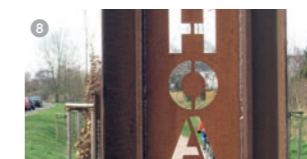
Die Bahntrasse der ehemaligen Hüttenwerke Oberhausen Aktien Gesellschaft (HOAG) verbindet den Duisburger Stadtteil Walsum mit Oberhausen Sterkrade. Die HOAG-Trasse diente ursprünglich dem Kohletransport von der Zeche Sterkrade zum Rheinhafen in Walsum. Nach fünfjähriger Umbauzeit wurde der kombinierte Rad- und Wanderweg im Mai 2007 der Öffentlichkeit übergeben.