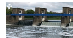
Die Ruhrschleuse am Ruhrwehr Duisburg ist die letzte Schleuse der Ruhr vor der Mündung in den Rhein. Schleuse und Wehr bilden entlang des Hafenkanaals zwischen dem Ruhrdeich und der Hafenzunge Pontwert eine funktionale Einheit. Das Wehr reguliert nicht nur den Abfluss des Ruhrwassers, sondern kann bei extrem hohen Rheinwasserständen auch verhindern, dass Rheinwasser in die Ruhr hochsteigt.